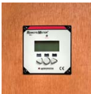
Montage dans le mur