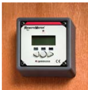
Montage dans le cadre