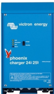
Phoenix charger 24V 25A